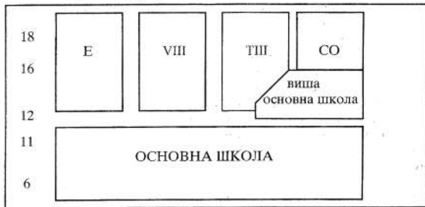
Шема 1а. Шема новообразовног система у варијанти А (основна школа од 6. до 11. године)

Шема бр. 1. РЕФОРМИСАНИ СИСТЕМ ОБРАЗОВАЊА на бази продуженог обавезног општег образовања на 12 година (шема 1а) (Опис: основно обавезно образовање траје осам година. Оно се слојевито артикулише, а могућности за то има више. Средње образовање овде је истоветно артикулисано, али се може артикулисати и другачије, па поједини делови средњег образовања, могу ићи још ниже, од шестог или седмог разреда основне обавезне школе, особито у делу општег образовања)